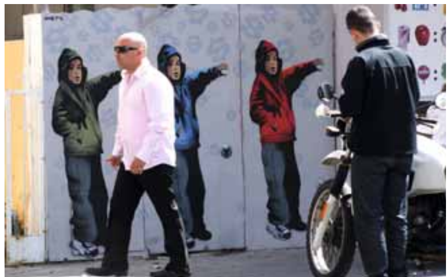
Jugend in der Kunst: Graffiti in Tel Aviv

Die komplexe Lebensrealität in Israel, das ist auch ein Ergebnis der Umfrage, macht die Befragten jedoch nicht ängstlich oder teilnahmslos. Generell ist die israelische Bevölkerung sehr jung; 2009 waren 43,6 Prozent 24 Jahre und jünger. Die Ergebnisse der 2010er Studie der Friedrich-Ebert-Stiftung, in Verbindung mit der aktuellen Welle der sozialen Proteste in Israel, liefern handfeste Anhaltspunkte, gerade diesen vielen jungen Menschen Raum für ihre Standpunkte zu geben und diese auch wahrzunehmen. Der Kikar HaMedina am 3. September soll nicht die einzige oder letzte Möglichkeit gewesen sein. Die Weltsicht der israelischen Jugendlichen, so paradox sie ist, kann – indem sie Kategorien sprengt – neue Ideen produzieren. ■