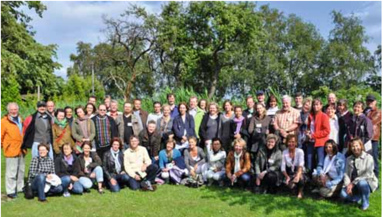
Wiedersehensfeier der ehemaligen Kibbuz-Besucher aus dem Landkreis Aurich

Aurich-Rahe mit Grillen und Disco. Die Stimmung unter den Teilnehmern war von Beginn an super; gleich nach der Begrüßung setzte ein intensiver Meinungsaustausch ein. Dabei erwies es sich als äußerst hilfreich, dass das Orgateam Namensschildchen vorbereitet hatte – inklusive ehemaliger Mädchennamen. Der erstaunte Ausruf „Ach Du bist das!“ war deshalb anfangs oft zu vernehmen.