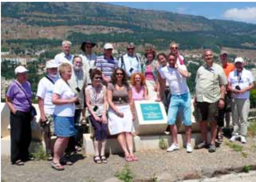
In Kiryat Schmona besuchte die Gruppe die Tafel des Jüdischen Nationalfonds (KKL), die an die Spende der DIG Berlin und Potsdam für 5000 Bäume im Norden Israels erinnert.