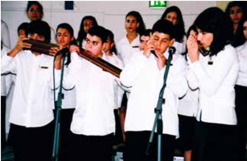
Vier Solisten des Orchesters, links ein Bass-Mundharmonika-Spieler

halb freiwillig mit in den Tod ging (am 5.8.1942 in das Konzentrationslager Treblinka), in ein anderes Haus außerhalb Warschaws verlegt worden war, von wo er dann kurze Zeit später nach Auschwitz deportiert wurde.