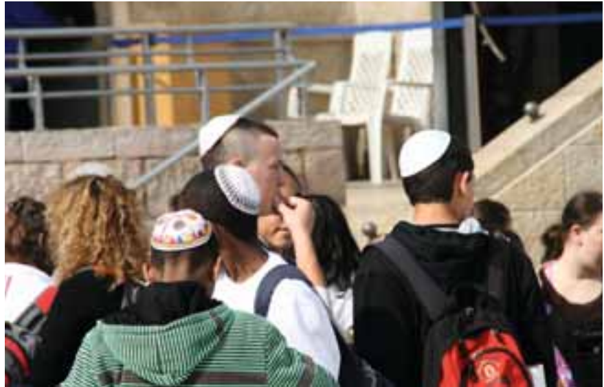
Israelische Jugendliche nahe der Klagemauer

Die Jugendkontakte zwischen Deutschland und Israel waren schon damals vielfältig und umfangreich – und doch gab und gibt es viel zu tun, um in guten wie in schwierigen Zeiten die Kontakte zwischen