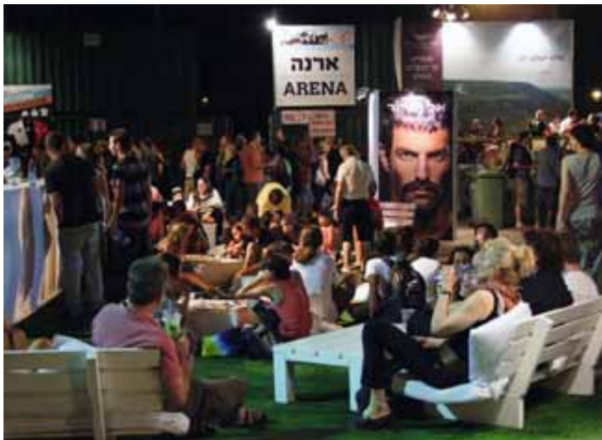
Eilat Jazz-Festival 2010

se erfuhr nur einen stark eingeschränkten Zuspruch. Der Israel-Palästina-Konflikt wird von vielen Jugendlichen als fester, unabänderlicher Bestandteil ihres Lebens und ihrer Alltagsrealität gesehen. Sie fühlen sich ihm gegenüber machtlos, sind aber auch bereit, ihn als gegeben zu akzeptieren. Auch im Rahmen der Protestbewegung 2011 wurde der Konflikt nur zögerlich und vereinzelt thematisiert; das Gros des Sozialprotests umschiffte das Thema.