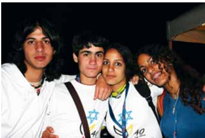
Israelische Jugendliche während des Gartenfestes des Bundespräsidenten

Kontakt: www.ConAct-org.de info@ConAct-org.de