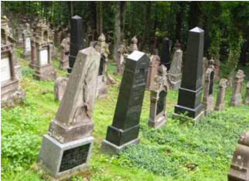
Der jüdische Friedhof von Rexingen

stützte die jüdischen Einwohner. Heute leben keine Juden mehr in Rexingen.