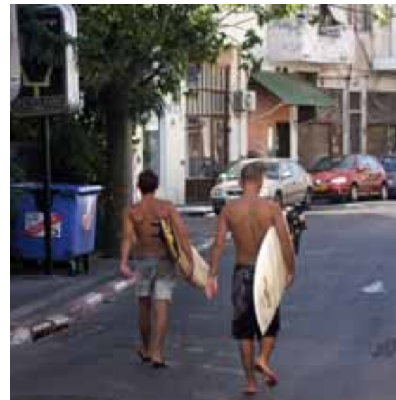
Jugendliche am Schabat in Tel Aviv

Die Zweischneidigkeit gerade in der Beziehung zwischen Juden und Arabern zeigt sich besonders deutlich beim Thema Israel-Palästina-Konflikt: Generell befürworten die Jugendlichen den Frieden mit den Palästinensern, aber viele ziehen die derzeitige Situation einer Friedenslösung mit Kompromissen vor. Lediglich gut 18 Prozent der jüdischen und knapp 23 Prozent der arabischen Jugendlichen räumen dem Frieden im Jahr 2010 höchste Priorität ein, 1998 waren es auf beiden Seiten jeweils mehr als zehn Prozent mehr. Für die Jugendlichen, die ihren Militärdienst noch nicht abgeleistet hatten, war Frieden 2010 generell wichtiger als für die 21 bis 24 Jahre alten Befragten, die bereits bei der Armee gewesen waren. Die