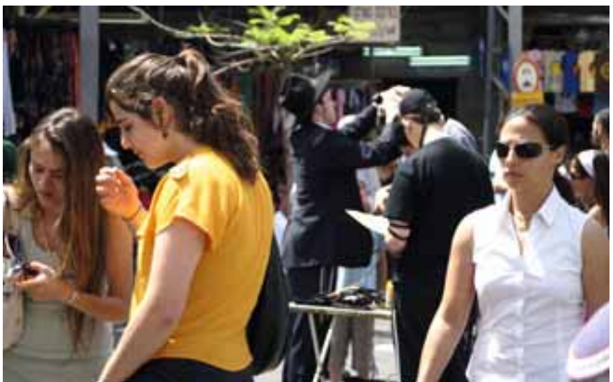
Tel Aviv am Freitagnachmittag

Juden und Araber, politisch Linke und Rechte, Religiöse und Säkulare sowie die jüngere und ältere Befragtengruppe gaben in den Studien, unabhängig von politischer Einstellung und Alter, stark unterschiedliche Antworten. Generell ist über die Jahre ein politischer Rechtstrend der Jugendlichen erkennbar; etwa zwei Drittel der befragten Juden ordneten sich selbst dem rechten Flügel zu. Die Unterstützung der Rechten stieg von 48 Prozent auf 62 Prozent von 1998 bis 2010, während die Unterstützung der Linken im selben Zeitraum um 20 Prozentpunkte auf 12 Prozent fiel. Außerdem steht die Definition Israels als ein jüdischer Staat bei immer mehr der jüdischen Befragten an erster Stelle (18 Prozent im Jahr 1998, 33 Prozent in 2010). 60 Prozent der 15 bis 18 Jahre alten Befragten bevorzugen laut der aktuellen Studie, sofern sie die Wahl hätten, starke Anführer gegenüber rechtsstaatlichen Prinzipien, 70 Prozent würden sich im Falle eines Konflikts zwischen demokratischen Werten und der Sicherheit des Staates für die Sicherheit entscheiden. Ähnliche Ergebnisse gibt es in