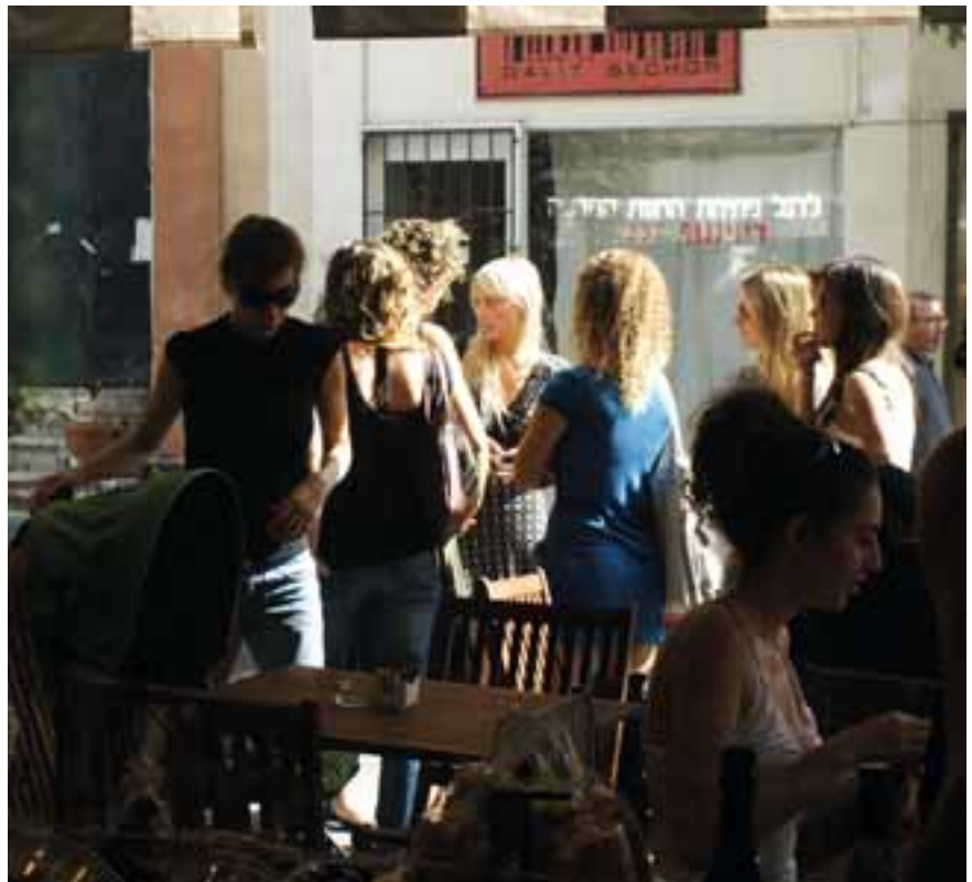
Tel Aviv, Neve Zedek

Forscher begründen das damit, dass die jungen Erwachsenen, die bereits gedient haben, möglicherweise den Frieden als unrealistischer oder auch weniger erstrebenswert einstufen als die jüngere Gruppe. Gleichzeitig waren es auch die 15- bis 18-Jährigen, die sich für eine Beibehaltung des Status Quo in der Friedensfrage aussprachen (52 Prozent im Gegensatz zu 40 Prozent bei der älteren Gruppe), eine Zwei-Staaten-Lösung beispielsweise