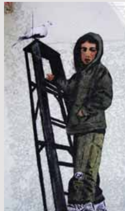
Jugend in Israel