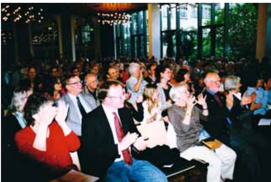
Mit 280 begeisterten Besuchern gut gefüllter Bürgersaal im Rathaus Kassel

Gan in Israel gastierte im Bürgersaal des Rathauses. Nach zweijähriger Vorlaufzeit und mit finanzieller Unterstützung der Stadt Kassel war dies möglich geworden.